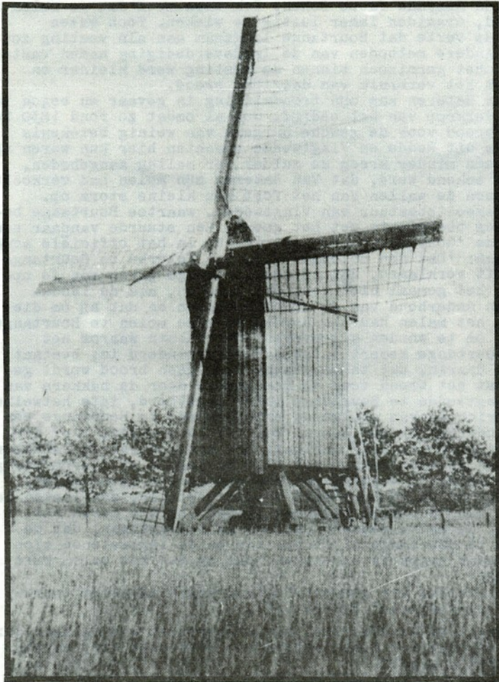
De molen bij Ter Haar naar een oude foto. Toen nog in gave toe- stand.