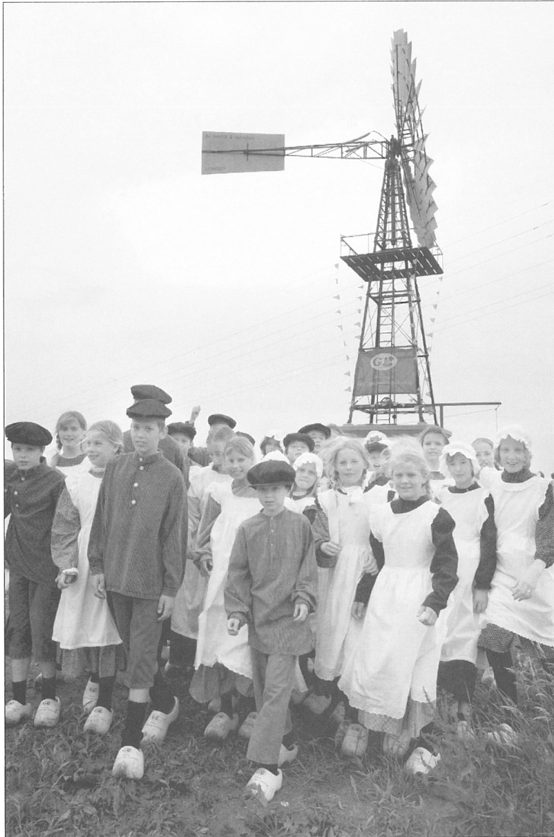
...en de nieuwe naam is: Koetze Tibbe

aan te voeren via een waterinlaat. Het water wordt weer langzaam weggepompt door een windmolen. Door deze aan- en afvoer van water ontstaan wisselende waterstanden en de natuur is daarbij gebaat. Ook wordt water zoveel mogelijk vastgehouden. Lager gelegen delen worden slikkig en in het slik zit veel voedsel voor steltlopers zoals de tureluur en de watersnip.