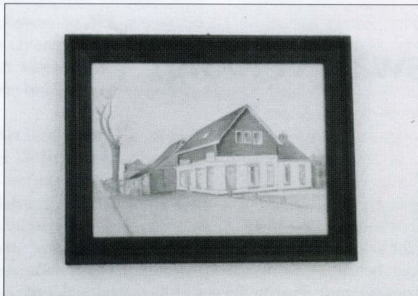
Café Het Middelste Vallaat in 1985 (tekening van de familie Liewes)

op de plaats van de hondenmolen bevindt zich een bar.