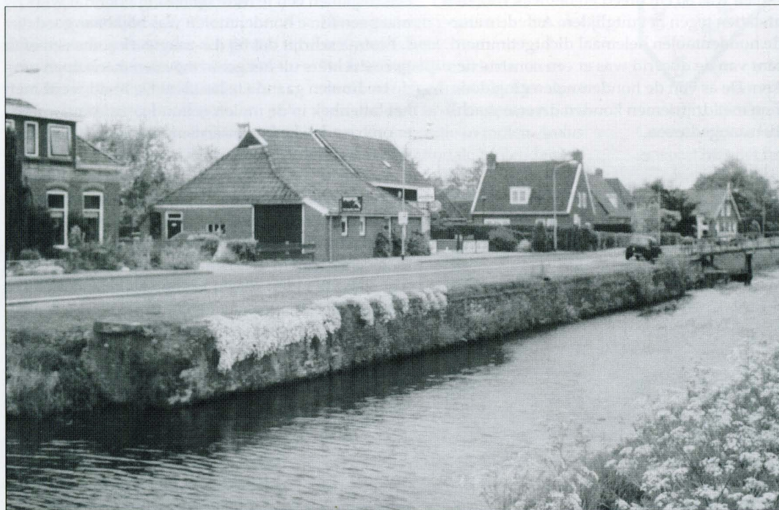
Locatie van de voormalige stelmakerij van Liewes

De hondenmolen bevond zich in de doorrid van het café. Dat is een onderdakse gang waarin een koets kan stoppen om de passagiers droog te laten uitstappen. Tegenwoordig zijn de grote houten deuren aan de terraskant vervangen door een glaswand en