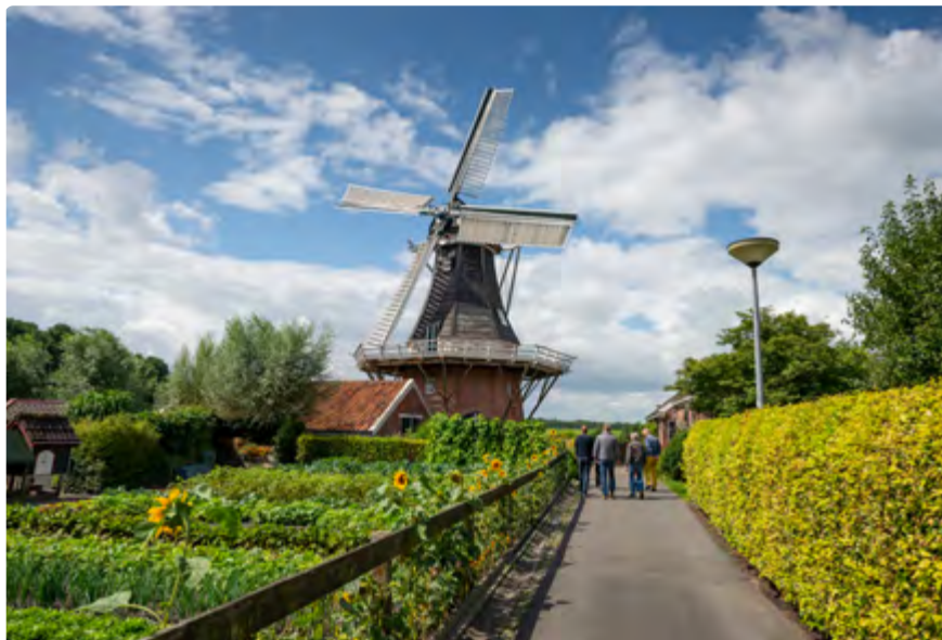
Beeld: molen De Noordstar Noordbroek; foto: Wim Giebels

Ook De Hollandsche Molen kan weer een 'echte' Nationale Molendag organiseren, dat wil zeggen dat de molens weer