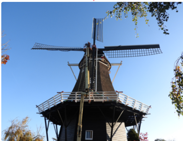
De Leeuw Zeerijp

De roeden zijn doorgehaald en behandeld tegen roestvorming.