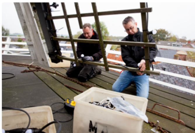
De Fortuna wordt versierd