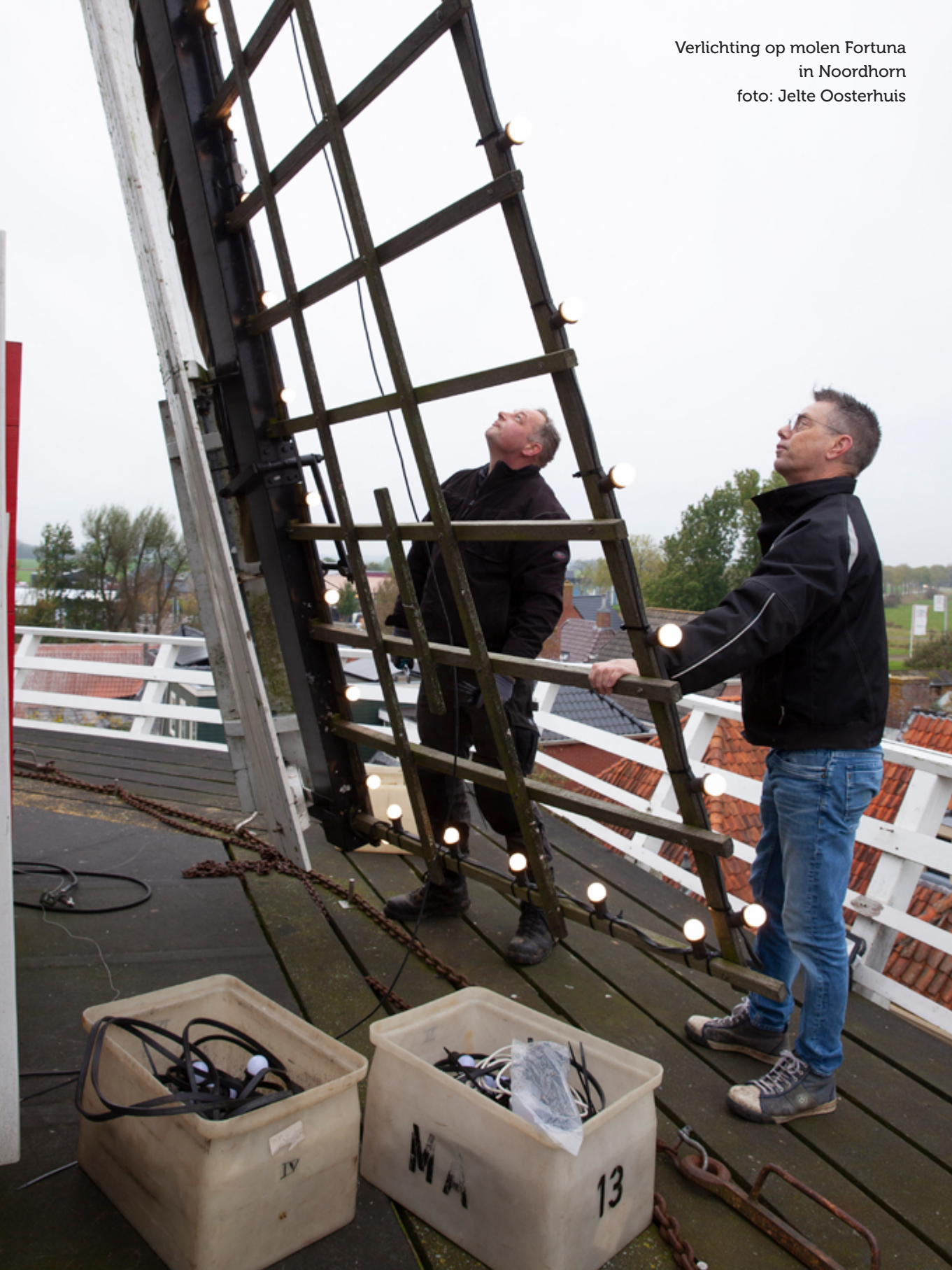
Verlichting op molen Fortuna in Noordhorn