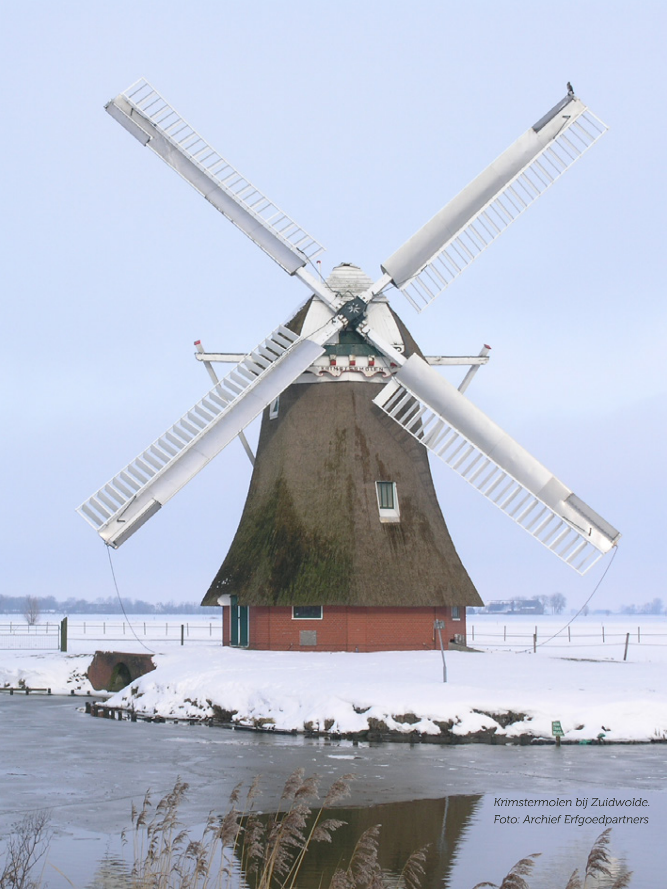
Krimstermolen bij Zuidwolde.