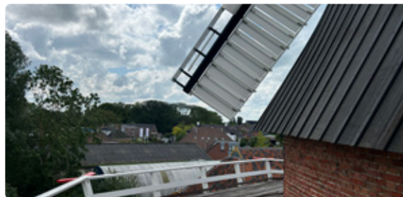
Uitzicht vanaf de stelling van de AEOLUS te Adorp

In de verte staat de recent gerestaureerde poldermolen met dezelfde naam als de streek waarin hij staat, Koningslaagte. Deze grondzeiler werd in 1878 gebouwd en wordt bij wateroverlast nog steeds ingezet voor extra bemaling naar de naastgelegen Oude Ae.