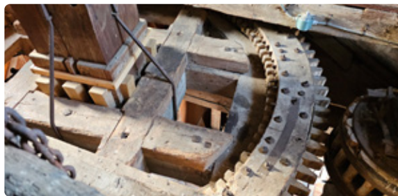
Spoorwiel van De Ster, grotendeels nog van de standerdmolen uit 1628

reldoorlog werd begonnen met het moderniseren van deze molen, hetgeen in 1952 werd voltooid. Er werd een pelsysteem met onderaandrijving geïnstalleerd. Desondanks raakte de molen in de jaren zestig in verval. In 2013 nam Molenstichting Winsum de molen voor een symbolisch bedrag van 1 euro over. Daarna kon een grondige restauratie plaatsvinden, die de molen in 2016 weer volledig maalvaardig maakte.