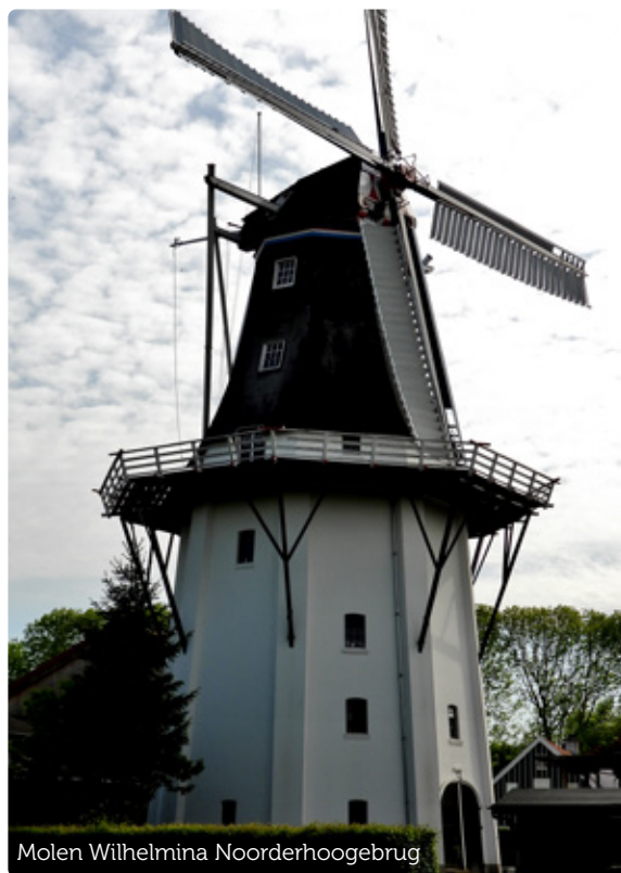
Molen Wilhelmina Noorderhoogebrug

Het startpunt is knooppunt 86, bij de kleurrijke brug van het Groninger Museum. Daarna door de stad via 87-95-96-89 naar knooppunt 1. Halverwege 89 en 1 staat de eerste molen van de fietstocht.