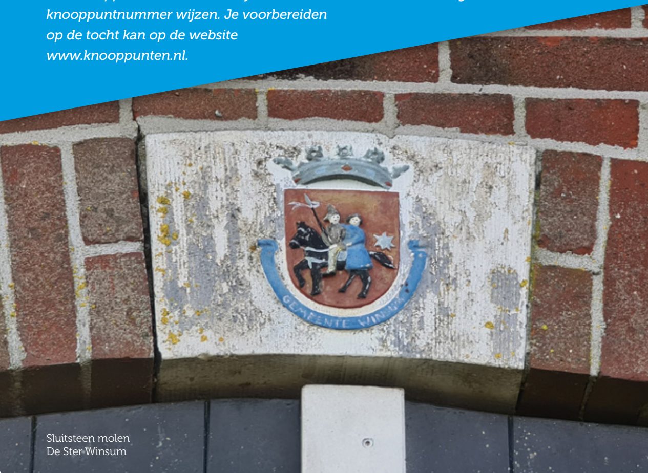
Sluitsteen molen De Ster Winsum

Noord-Groningen biedt prachtige vergezichten. Waar je ook bent, je ziet in de verte altijd wel een kerk of molen. Zelfs in grotere woonkernen zie je wieken en torens. Gezien de vele fietspaden is het niet zo moeilijk om mooie molenfietsroutes te bedenken. De hieronder beschreven 55 km fietstocht beperkt zich tot de streek langs het Reitdiep, een kronkelend verhaal. De route begint bij het station van Groningen, waar het gemakkelijk is om een fiets of e-bike te huren. Voor de wegaanduiding van deze fietsroute volgen we fietsknooppunten. Groene bordjes met nummers die naar het volgende knooppuntnummer wijzen. Je voorbereiden op de tocht kan op de website www.knooppunten.nl .